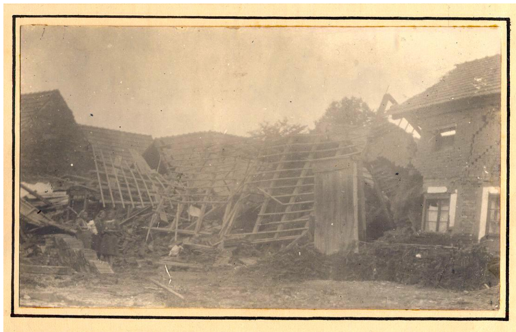
Dílo dravého živlu na Malé straně

Zachránili se duchapřítomností otcovou. Rodiče s oběma sourozenci utekli před přívalem na komoru. Když pak slyšeli podezřelý praskot v celém domě, proboural otec díru do štítu, kterou se dostali z komory na půdu a odtud druhým štítem nakvap probouraným se dostali na patro v chlévě. Chlév byl postaven celý z kamene a otec správně usoudil, že ten nejdéle odolá přívalům vod. Předvídal správně. Kamenný chlév vydržel, takže vyvázli bez pohromy. Z celého zařízení domku jsme zachránili pouze hodně poškozený šicí stroj a krávu, kterou otec odvedl už v poslední chvíli, kdy už se téměř topil v přívalu vody, do stodoly.